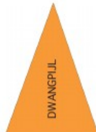
DWANGPIJL VERPLICHTE RIJRICHTING