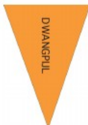
DWANGPIJL VERBODEN IN TE RUDEN