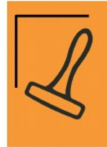
ONBEMANDE STEMPELCONTROLE (ZELFSTEMPELAAR)